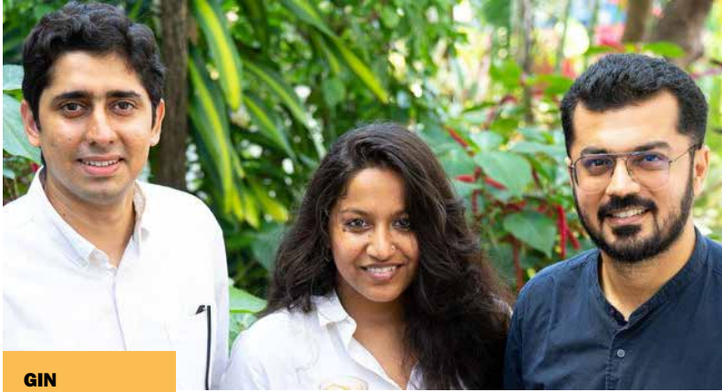
GIN I FONDATORI DI NAO SPIRITS.